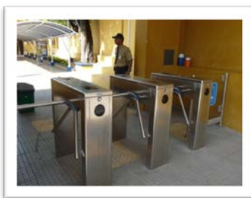
Sistema de Control de Acceso