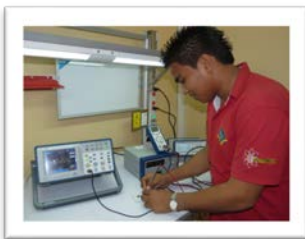
Laboratorio de Electrónica