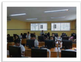
Sala de Bilingüismo

Tres laboratorios, uno de bilingüismo, uno de electrónica y uno de cisco.