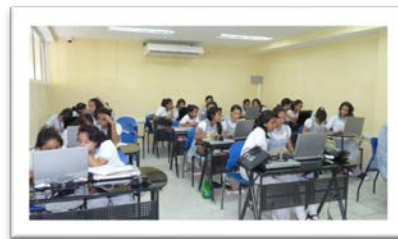
Laboratorio de Cisco